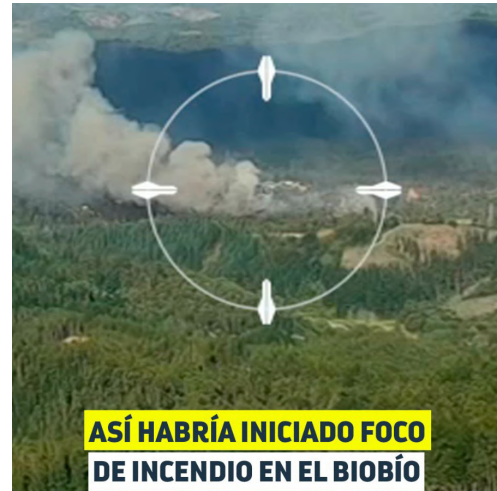
ASÍ HABRÍA INICIADO FOCO DE INCENDIO EN EL BIOBÍO

Los alcaldes y ediles de la Florida y Penco, pidieron adelantar el toque de queda a las 20:00 hrs. El gobierno de Boric desestimó la solicitud, por razones logísticas. El presidente electo J. A. Kast, reunido con dirigentes vecinales, apoyó de facto el anticipo al toque de queda. Y, además, ofreció la tecnología de los drones israelí para vigilar la seguridad de las casas vacías, mientras llegaban los militares. Esta es la operatividad verdadera e inmediata que la gente solicita de sus autoridades gobernantes. Todos nos preguntamos, adonde van los impuestos que pagamos cuando compramos pan, aceite, azúcar, te o café, si no es para financiar un gobierno competente, inteligente, reaccionario a las difíciles contingencias.