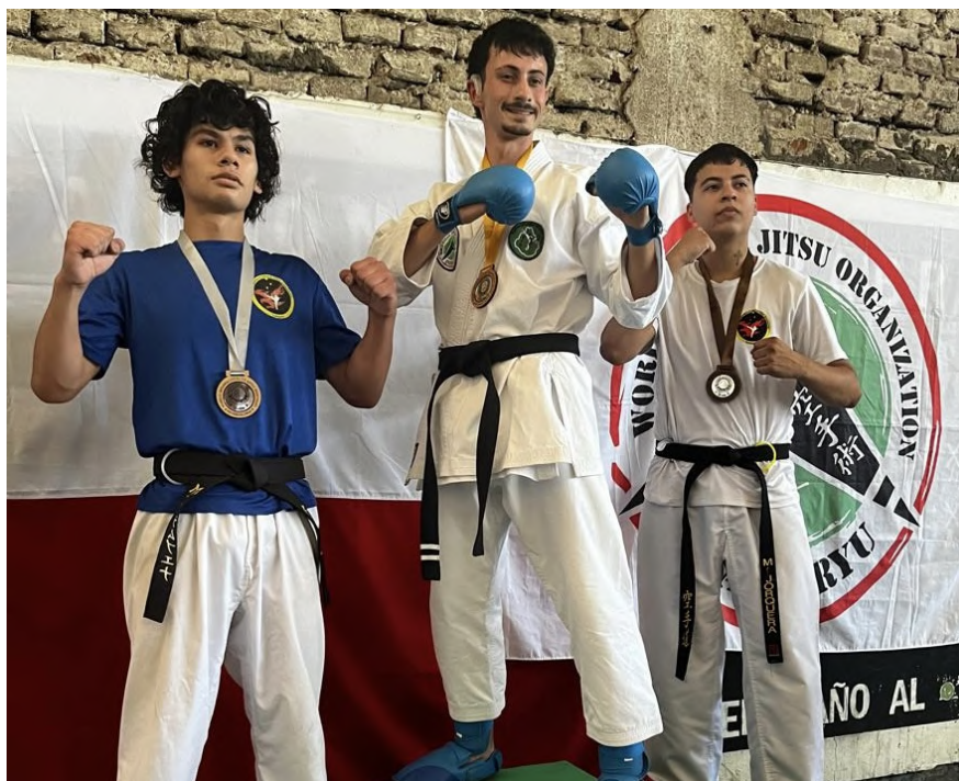
Este triunfo no solo reafirma el talento local, sino que les otorgó el pase directo al prestigioso Torneo Qiang Internacional

¡A seguir preparándose para dejar nuestra bandera en lo más alto en Bariloche!