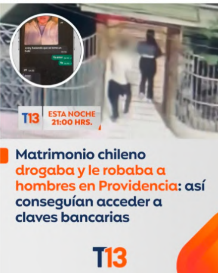
Matrimonio chileno drogaba y le robaba a hombres en Providencia: así conseguían acceder a claves bancarias

El matrimonio vivía en Curacaví, tenía cinco hijos y en solo dos de los casos investigados obtuvieron varios millones de pesos mediante este método >> https://www.t13.cl/746891-fb .