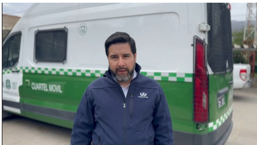
Las diligencias fueron realizadas por personal especializado de la Sección de Investigaciones Policiales (SIP) de la 63 Comisaría de Curacaví y la Tenencia de María Pinto