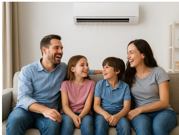
Uno de los errores más comunes es configurar los equipos en temperaturas extremadamente bajas. “Lo ideal es mantener el aire acondicionado entre 23°C y 25°C.”

Con estos consejos, es posible preparar la casa para los meses de mayor calor, asegurando ambientes frescos, un uso eficiente de la energía y el máximo rendimiento de los equipos de climatización.