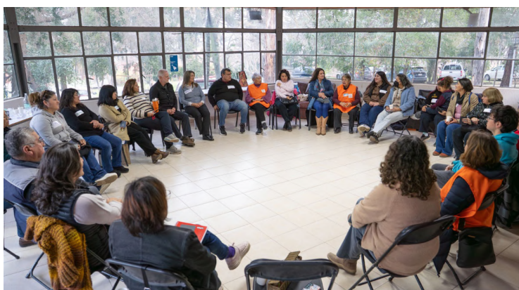
Se han capacitado a 50 vecinos voluntarios para brindar acompañamiento, creando una red de apoyo local

único en su tipo, que se desarrolla semanalmente durante todo el año, para que los vecinos que han perdido seres queridos puedan apoyarse mutuamente.