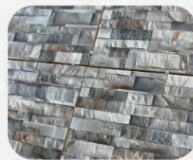
FACHALETA COLORADO MARRON