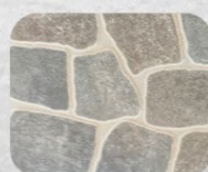
CERAMICA LAJA GRIS