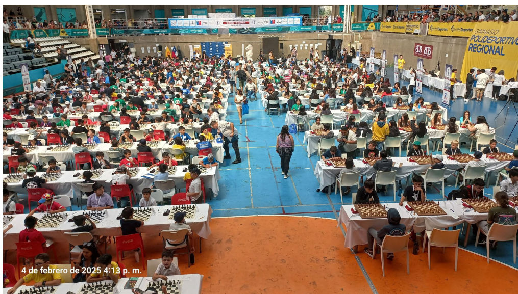
4 de febrero de 2025 4:13 p. m.

Este evento es clave para la selección de los mejores ajedrecistas chilenos en varias categorías, tanto damas como varones, quienes representarán al país en competiciones internacionales como el sudamericano, panamericano y mundial