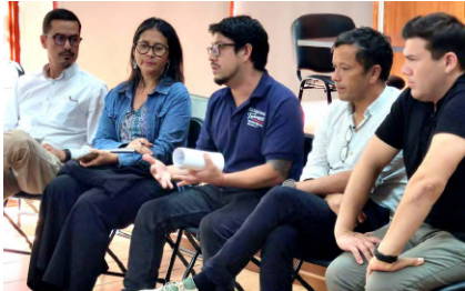
La actividad contó con la participación de los municipios de Quilpué, Curacaví, María Pinto, Delegación Provincial de Marga Marga

• El objetivo es impulsar acciones legales y medioambientales conjuntas para proteger las cuencas hídricas de los territorios que eventualmente se verían afectados.