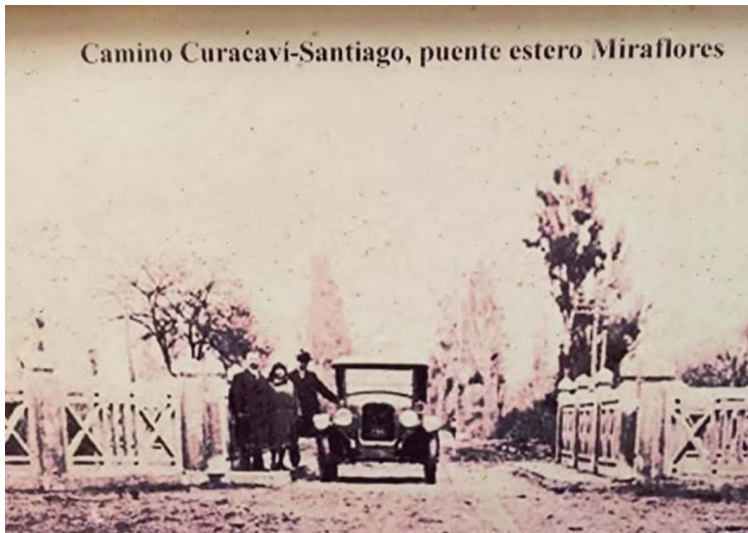
Camino Curacaví-Santiago, puente estero Miraflores