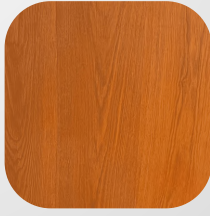
PISO FLOTANTE CEREZO