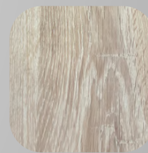
PISO FLOTANTE PARANA