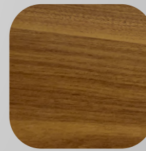
PISO FLOTANTE AMAPOLA