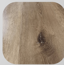
PISO FLOTANTE ENCINO