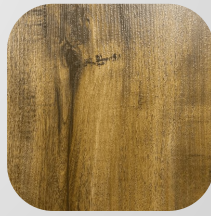
PISO FLOTANTE ALERCE