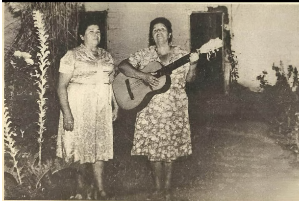
de todas las, no pueden faltar en las ceremonias y fiestas locales.