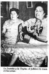
La Juanita y la Toyita: el folklore lo traen en las venas.