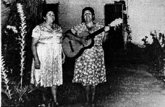
de todas las, no pueden faltar en las ceremonias y fiestas locales.