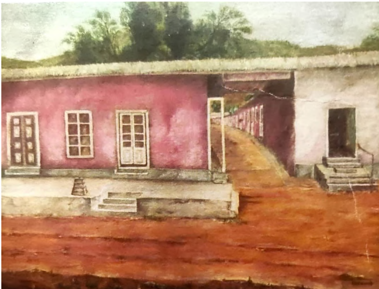
Óleo de Marco Wolchkovich Acevedo, Municipalidad Antigua.