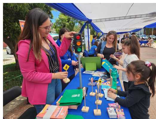
Entre las instituciones presentes se encontraron universidades, centros de formación técnica, y organismos de orientación vocacional