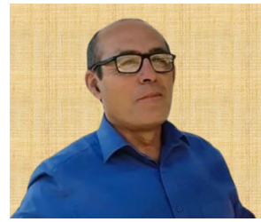
Por: Víctor Méndez