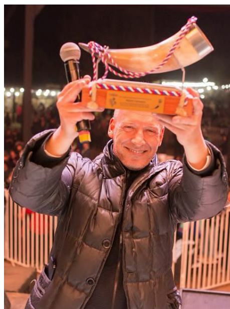
La Fiesta de la Chicha ofreció una variedad de actividades y atracciones para el disfrute de los asistentes