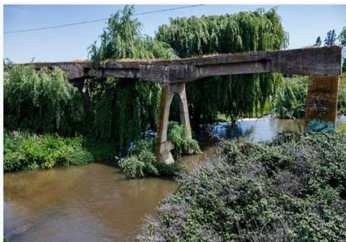
Resto de puente ferroviario sobre estero La Higuera, Bollenar