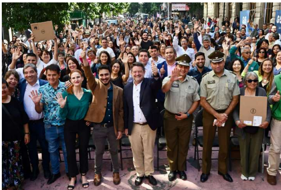
La iniciativa, que supera los $400 millones de inversión, también capacitará a las Juntas de Vecinos beneficiadas para concientizar sobre la importancia de realizar denuncias electrónicas