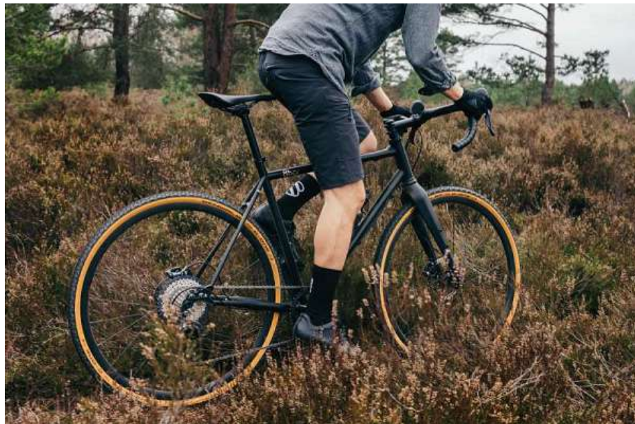
Este accidente le causó varias lesiones, entre ellas, heridas significativas en la cabeza

recibir atención especializada. En un segundo evento, ocurrido horas más tarde en la Cuesta Ibacache, un camión terminó volcándose al lado de la carretera. De manera afortunada, el conductor del vehículo pesado salió ileso del accidente, evitando así un desenlace más trágico. Para responder a ambos sucesos, se desplegaron equipos de atención médica del Municipio, así como efectivos de Bomberos y de Seguridad Pública, quienes trabajaron