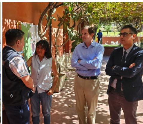
La reunión tuvo por objetivo evaluar el Plan de Acción propuesto por la empresa para mejorar la situación de los reiterados cortes del suministro eléctrico