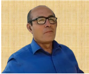
Por Víctor Méndez

P or mi ACV me convertí en un devorador de documentales de youtube, de no ser por mi ACV nunca me pondría como objetivo ver, conocer y visitar, antes de morir el fabuloso país de Marruecos.... No creen, ya lo verán. De no ser por mi ACV nunca hubiera asociado a Einstein con Hitler y la bomba atómica en Hiroshima, de no ser por mi ACV nunca hubiera asociado el hospital, (no el Hospital de Curacaví) con un "Centro de Tortura". Debo decir de verdad que sufrí allí, que me desesperé, que lloré por volver a Curacaví, a mi casa, con mi familia. Como estoy hospitalizado en casa ahora más que nunca los doctores quieren que vea un psicólogo, no querrán ustedes saber mi opinión sobre los...psicólogos.... Para que me quite la pena "dicen" HE, HE, HE imagino que luego de tratarme haremos fiesta o ¿qué sentido tiene?