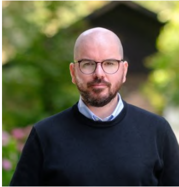
La Cámara de Diputados aprobó en una votación re-

lizada este miércoles un proyecto de resolución que insta al presidente Gabriel Boric a solicitar la renuncia del ministro de Desarrollo Social, Giorgio Jackson. La iniciativa contó con el voto a favor del diputado del Partido Por la Democracia (PPD), Raúl Soto. El proyecto de resolución argumenta que la gestión de Giorgio Jackson al frente del Ministerio de Desarrollo Social y Familia ha sido deficiente, especial-