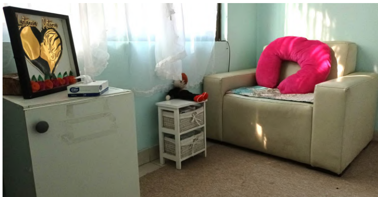
El Jardín Infantil Joaquín Blaya ha llevado a cabo diversas actividades para promover la lactancia materna exclusiva.

dres también pueden ejercer este derecho a través del método "canguro" o piel a piel, una práctica que se promueve activamente en el Jardín Infantil Joaquín Blaya. Este método proporciona numerosos beneficios para los pequeños, como reconocer aromas, escuchar la voz de su padre, recibir calor, abrazos y arrullos, lo que fortalece el apego efectivo entre padre e hijo.