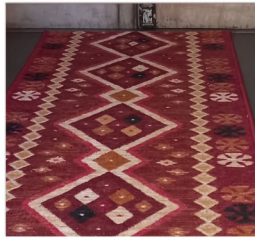
ALFOMBRA PASILLO ANKARA ROJO $6.200 METRO LINEAL