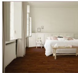
PISO VINÍLICO ATLANTIC OAK $7.120 M2