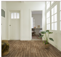
PISO VINÍLICO ATLANTIC ANTIQUE $7.120 M2