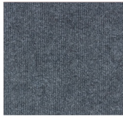
CUBRE PISO DE ALTO TRÁFICO $3.362 M2