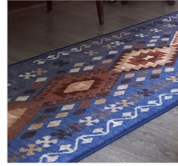
ALFOMBRA PASILLO SIVAS AZUL $6.200 METRO LINEAL