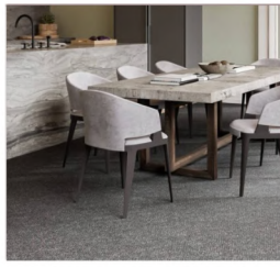
ALFOMBRA MURO A MURO TROCK $5.705 M2