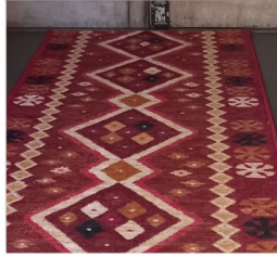
ALFOMBRA PASILLO ANKARA ROJO $6.200 METRO LINEAL