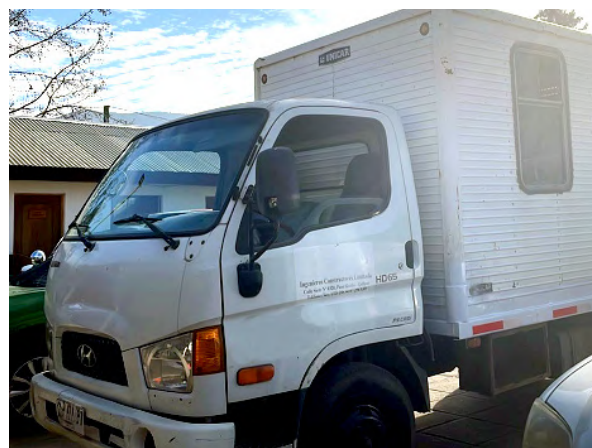
Durante la investigación, se detuvo al ocupante del domicilio con el cargo de receptación

El pasado miércoles 14 de junio, se produjo un robo de una camioneta y un camión en la comuna de Casablanca. Tras la alerta emitida por los afectados, las patrullas de seguridad pública municipal de la Municipalidad de Curacaví iniciaron la búsqueda de los vehículos robados y lograron encontrar la camioneta sustraída en calle Independencia a la altura del 1900, según lo informado por la Municipalidad de Curacaví en sus redes