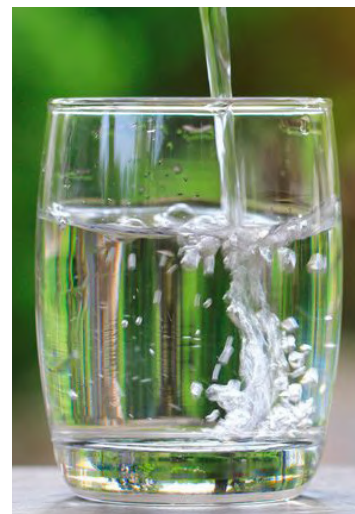
Rafael Delfín. Fuente: https://www.cancer.org/es/cancer/noticias-recientes/cuanta-agua-debo-tomar.html#:~:text=La%20mayor%C3%ADa%20de%20los%20hombres,de%20modo%20que%20tambi%C3%A9n%20cuentan.

Escrito por Stacy Simon. Traducción por Context Global Inc. Editado por