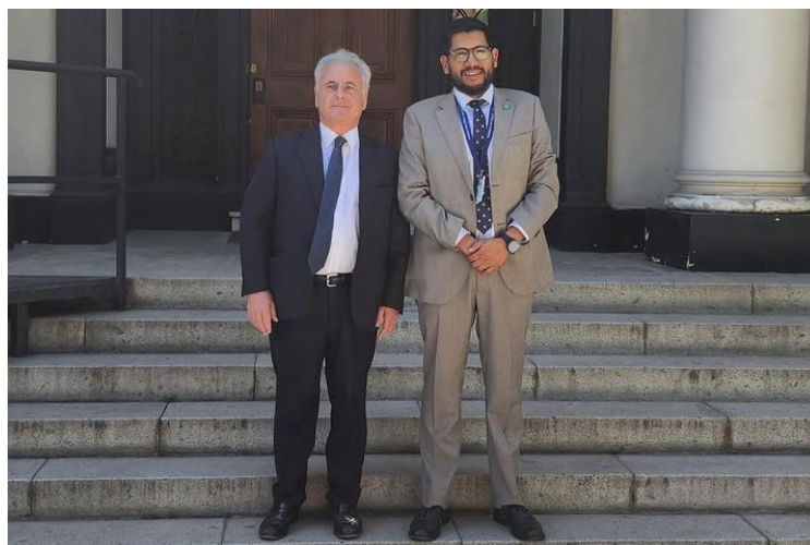
Es el primer encuentro de acercamiento como delegación para ver varios temas de apoyo a la Provincia, en materia hídrica, educación, turismo e innovación agroalimentaria

El jefe de gabinete de delegación Provincial añadió que paralelamente se inició conversaciones con la Cámara de Comercio Italiana, para apoyar a los emprendedores de la provincia, “así ellos puedan compartir y mostrarnos su experiencia en el ámbito del cooperativismo y el área agroalimentaria que han desarrollado por más de 50 años”.