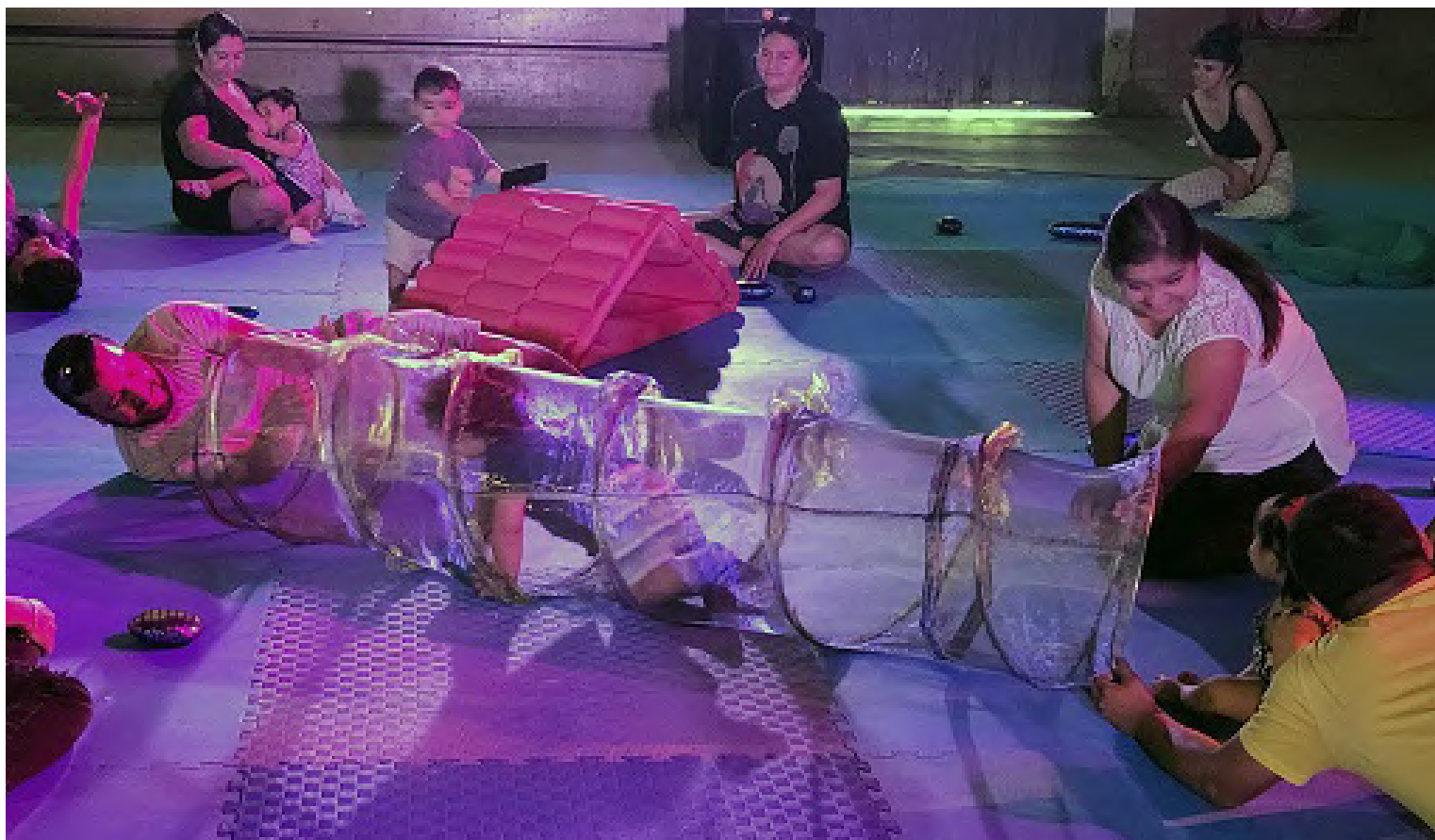
"Atlas Danza para Bebés", una obra multisensorial que sirvió para estimular los sentidos de los más pequeños de la casa

El pasado sábado en el Centro de Eventos Municipal Joaquín Blaya se presentó "Atlas Danza para Bebés", una obra multisensorial que sirvió para estimular los sentidos de los más pequeños de la casa, uniendo danza contemporánea, música