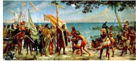
Llegada de Colón a América (de Internet)

de los monarcas, tenían los mismos derechos que cualquier español peninsular. Sin duda los reyes conocían demasiado la naturaleza de los humanos europeos, que se aventuraban en estas tierras. Esta fue la principal preocupación de la reina Isabel la Católica y de Fernando de Aragón. Ese fue el sello de esta conquista, que lo diferenció sustancialmente de otras experiencias colonizadoras del viejo mundo, como la impulsada en África por franceses, alemanes, ingleses, belgas portugueses, cuya impronta fue esclavizar a los habitantes de esas tierras, para realizar el atractivo negocio de esclavos. Fenómeno