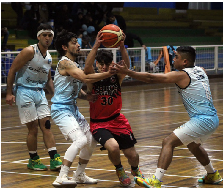
La novedad es la presencia del club La Viña, quien tendrá su estreno enfrentando a Deportivo Liceo.

Este sábado se inicia el Torneo de Clausura de la Liga Municipal de Básquetbol, segunda competencia de la temporada 2022, organizado por la Oficina de Deportes de la Municipalidad de Curacaví. Para esta ocasión la novedad es la presencia del club La Viña, quien tendrá su estreno enfrentando a Deportivo Liceo. Uno de los encuentros